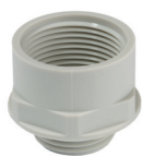
Резьбовой переходник/ адаптер